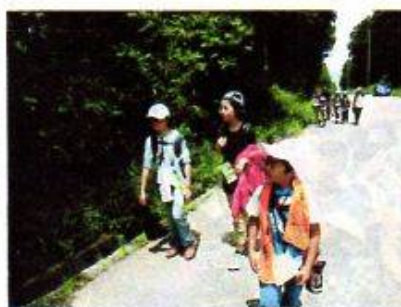
「妙高自然の家への道中」

PTA主催で開催されました。 新しく小学校に入学される子ど もさんの安全に対する取り組み として、毎年実施されています。