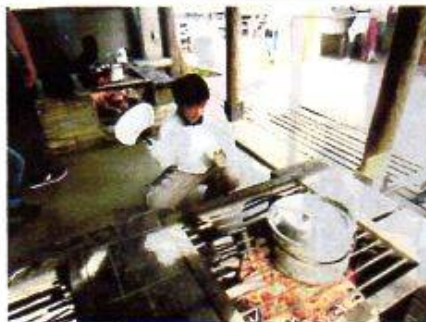
「カレーライス作り」

第20回「リーダーと宿泊交流会」 六月十一日(土)〜十二日(日) 篠ノ井中央地区主催の第20回 「リーダーと宿泊交流会」が妙高 自然の家での行われ、篠ノ井中央 地区の子どもさんが参加された。 御幣川区の子どもさんの参加がな かったのが残念でした。来年はぜ ひ参加していただきたい。