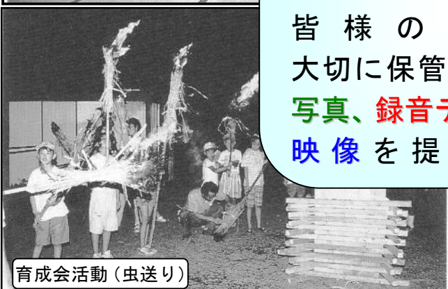
育成会活動(虫送り)