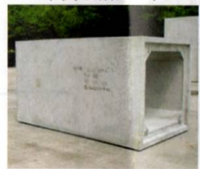
U字溝(自由勾配側溝)