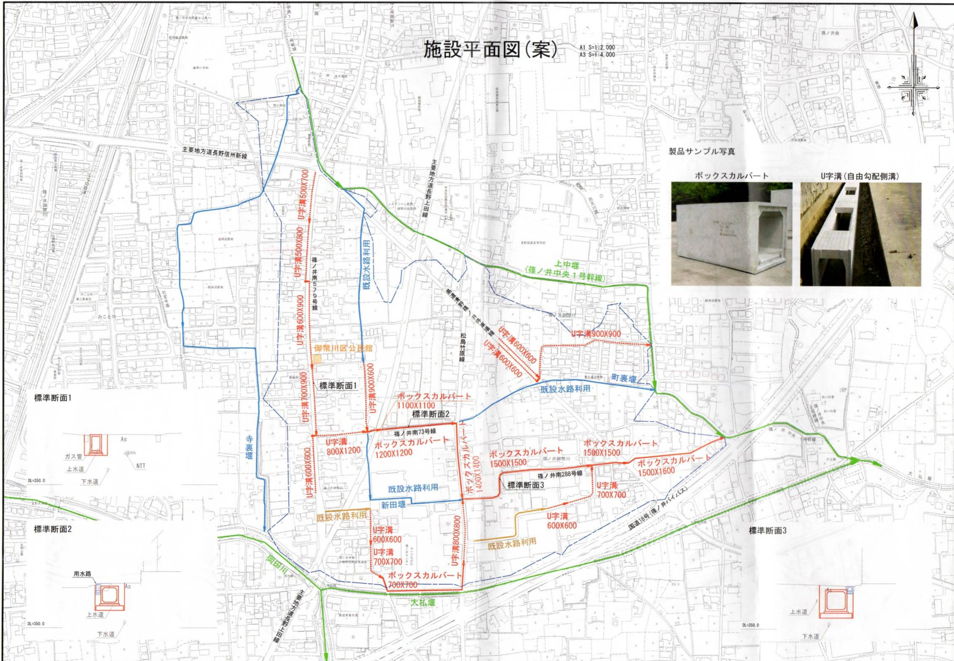
製品サンプル写真